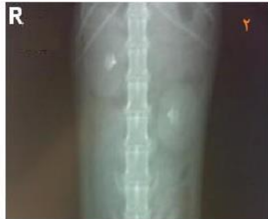
تصویر ۲: شکل و موقعیت کلیه ها در رادیوگراف. (۲-۱) حالت گماری جانبی، (۲-۲) حالت گماری شکمی-پشتی

در سنجاب نسبت اندازه طول کلیه ها به اندازه طول مهره دوم کمری در نمای شکمی-پشتی 2/20 \pm 0/13 است. طول کلیه و طول مهره دوم کمری در نمای شکمی-پشتی در جدول ۲ نمایش داده شده است.