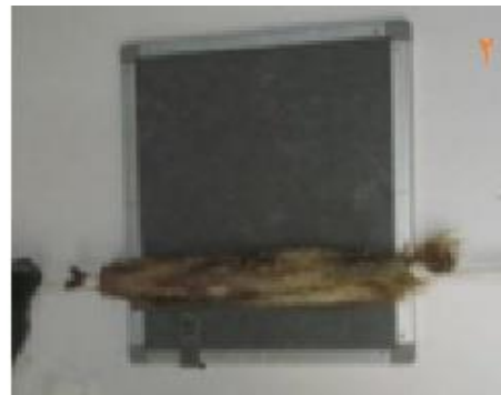
تصویر ۱: حالت گماری سنجاب ها جهت تهیه رادیوگراف. (۱-۱) حالت گماری جانبی، (۲-۱) حالت گماری شکمی- پشتی

تهیه شده مورد مطالعه قرار گرفتند و فاکتور زیر از استخراج شدند. ای فاکتور ها عبارت بودند از: شکل کلیه ها، اندازه کلیه ها، محل قرارگیری کلیه نسبت به ستون مهره ها و همچنین نسبت به کلیه طرف مقابل. جهت بررسی آماری نتایج کمی این مطالعه از آماری T-test موجود در بسته نرم افزاری SPSS استفاده شد.