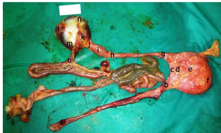
تصویر ۲. لوله گوارش مرغ مروارید ماده بالغ. a ابتدای مری گردنی، b انتهای مری گردنی، c گذرگاه چینه‌دان، d پایه چینه‌دان، e بخش میانی چینه‌دان، f ته کیسه چینه‌دان، g ابتدای مری سینه‌ای، h انتهای مری سینه‌ای، i پیش معده، j تنگه، k عضله قدامی پشتی سنگدان، l عضله خلفی تحتانی سنگدان، m عضله پشتی جانبی سنگدان، n عضله تحتانی جانبی سنگدان، o دوازدهه. اندازه میله ۳ cm.