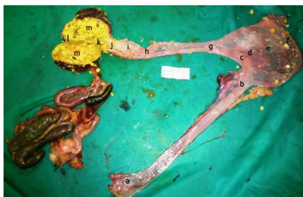
تصویر ۴- لومن باز شده لوله گوارش مرغ مروارید نر بالغ. a ابتدای مری گردنی، b انتهای مری گردنی، c گذرگاه چینه دان، d پایه چینه دان، e بخش میانی چینه دان، f ته کیسه چینه دان، g ابتدای مری سینه‌ای، h انتهای مری سینه‌ای، i پیش معده، j تنگه، k ته کیسه قدامی سنگدان، l ته کیسه خلفی سنگدان، m لایه کوتیکولی سنگدان. اندازه میله ۳ cm.

جدول ۱- میانگین طول و عرض مری، چینه‌دان، پیش معده و سنگدان بر حسب میلی متر