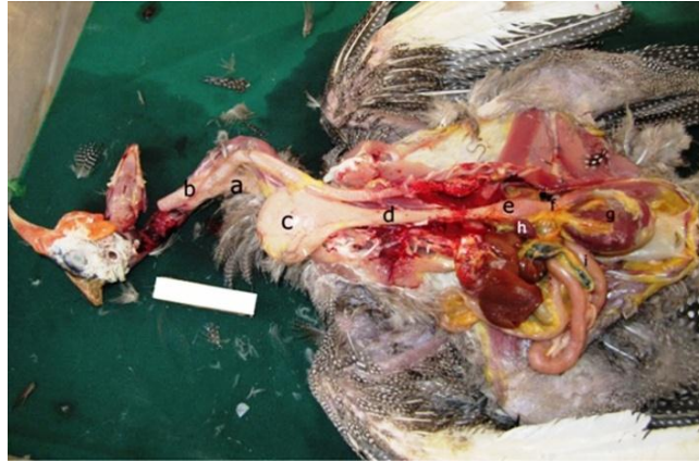
تصویر ۱. محوطه بطنی مرغ مروارید نر بالغ. a. مری

گردنی، b نای، c چینه‌دان، d مری سینه‌ای، e پیش معده، f تنگه، g سنگدان، h طحال، i دوازدهه.