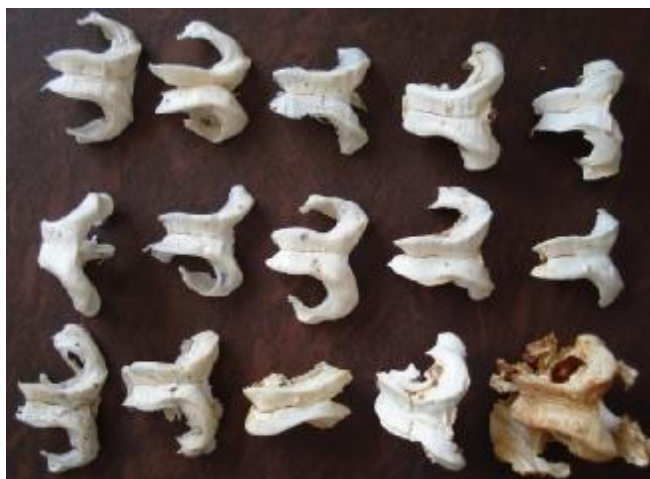
تصویر 3: تعدادی از قالبهای آماده شده از بطنهای مغزی.