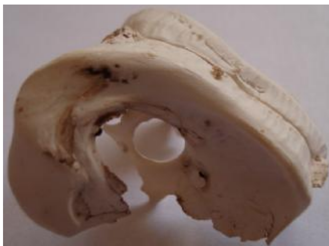
تصویر 4: قالب سیلیکونی از بطنهای مغزی از نمای جانبی.