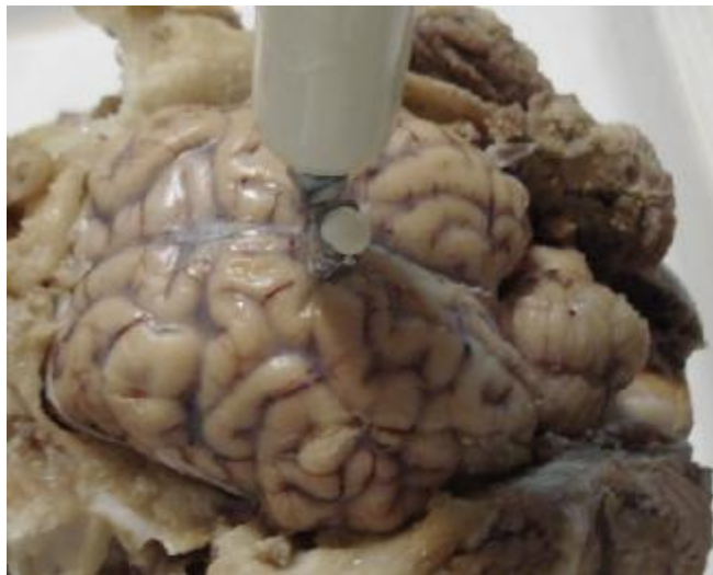
تصویر 2: پر شدن بطن های مغزی با خروج سیلیکون از سرسوزن دیگر.